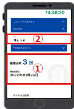
【新型コロナウイルスワクチン接種証明書アプリ】