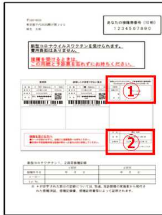
【予防接種済証 (パターン2)】